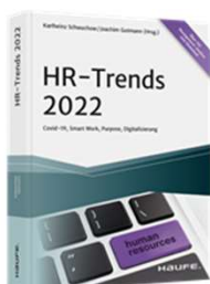
HR-Trends 2022 ISBN 978-3-648-15293-5 € 109,00 [D]

Von den Herausgebern sind auch folgende Titel erhältlich: